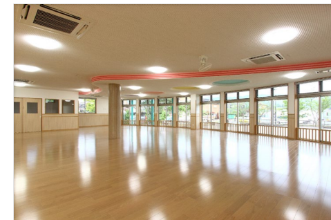
幼保連携型認定こども園 七尾みなとこども園