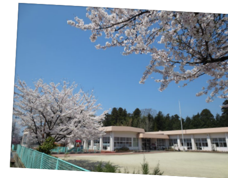
幼保連携型認定こども園 東みなとこども園