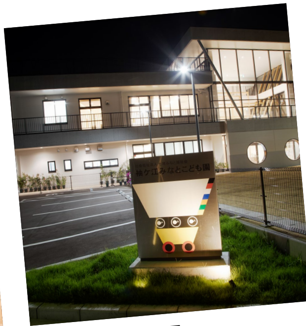
幼保連携型認定こども園 袖ヶ江みなとこども園